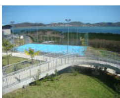
Le Terrain de sport