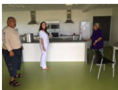
La cuisine thérapeutique